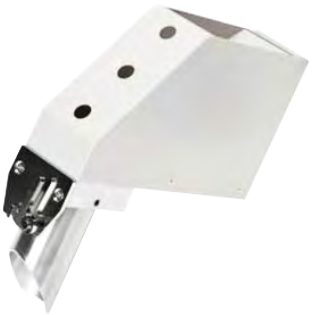
Тубы под мешки