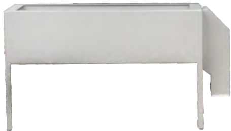
Стальной лоток с автоматическим механизмом подачи монет в загрузочный бункер