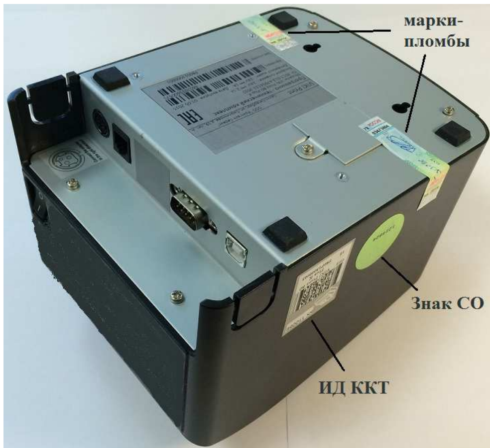
Рис.2 Места установки марок-пломб и место пломбировки ОБ ПТК